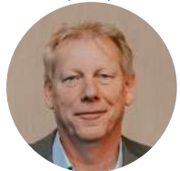
Mark Boekwijt Représentant de l'UE pour Amsterdam, Ville d'Amsterdam (Pays-Bas)