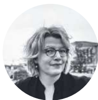
Sophie Lavaux Haut fonctionnaire de l'Agglomération bruxelloise et directrice générale de safe.brussels