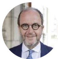
Fabrice Cumps Bourgmestre d'Anderlecht (Belgique)