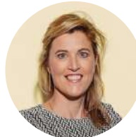
Annelies Verlinden Ministre de l'Intérieur (Belgique)