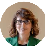
Catarina Sarmento e Castro Ministre de la Justice (Portugal)