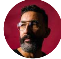
Marwan Mohammed Sociologue, Centre national de la recherche scientifique - CNRS (France)