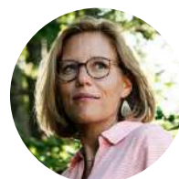
Ine Van Wymersch Commissaire nationale aux drogues (Belgique)