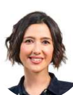
Nuria Parlon Gil Maire de Santa Coloma de Gramenet (Espagne)