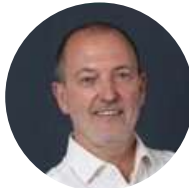
Roger Vicot Député de la 11e circonscription du Nord (France)