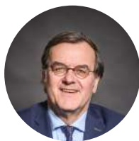
Willy Demeyer Bourgmestre de Liège (Belgique), Président du Forum européen pour la sécurité urbaine (Efus)