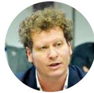
Matteo Luigi Bianchi Rapporteur du Comité des régions sur la feuille de route de l'UE pour la lutte contre le trafic de drogue et la criminalité organisée, Comité européen des régions (groupe ECR)