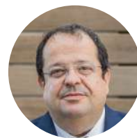
Joan Ignasi Elena Ministre de l'intérieur, Gouvernement de Catalogne (Espagne)