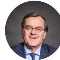
Willy Demeyer Bourgmestre de Liège (Belgique), Président du Forum européen pour la sécurité urbaine (Efus)