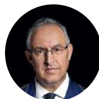
Ahmed Aboutaleb Maire de Rotterdam (Pays-Bas), Vice-Président du Forum européen pour la sécurité urbaine (Efus)